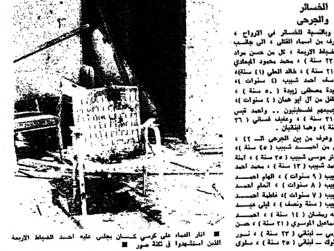
انار الغمام على كرسي كسان يجلس عليه احد الضباط الاربعة الذين استشهدوا في تلكه صور